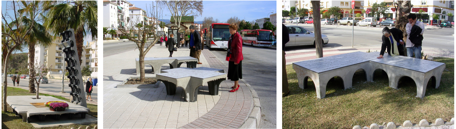
Ramo de flores sobre una de las plataformas. Bancos y almendro con la estación de “La cochinita” al fondo. Familiares de víctimas entorno a un banco.

puede mantener viva la memoria sino nuestro compromiso, sólo nosotros mismos. En esto nada puede sustituirnos.