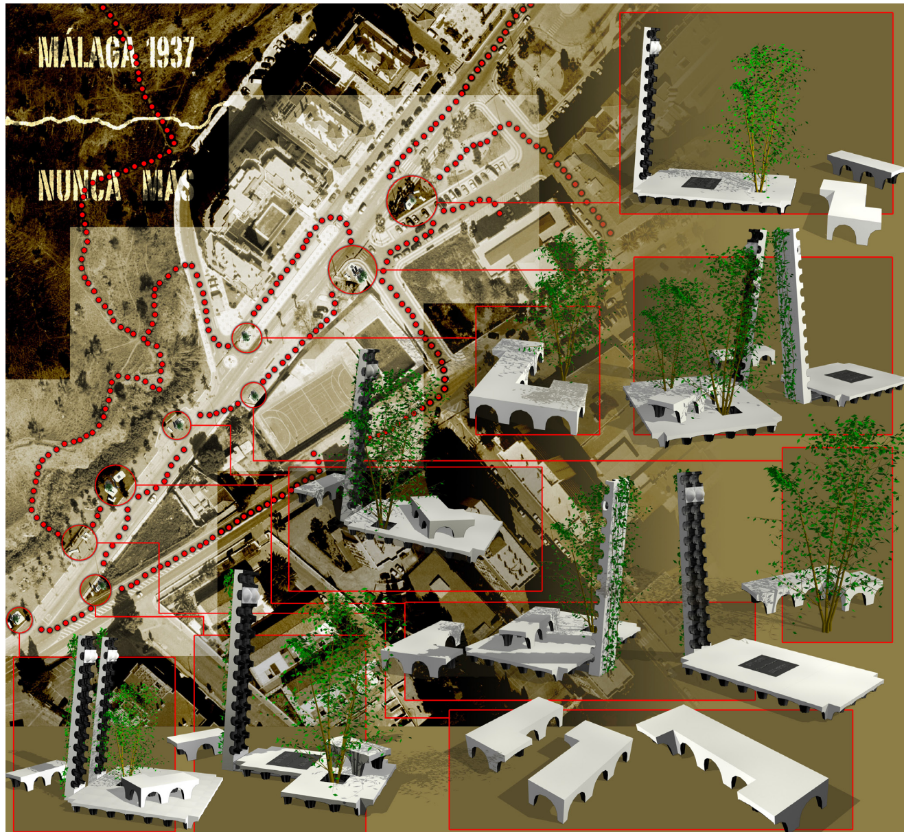
“Málaga 1937 / Nunca más” Plano de presentación. En la página de la derecha Plano estructural