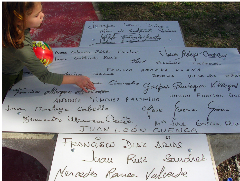
Banco con los nombres de la memoria.