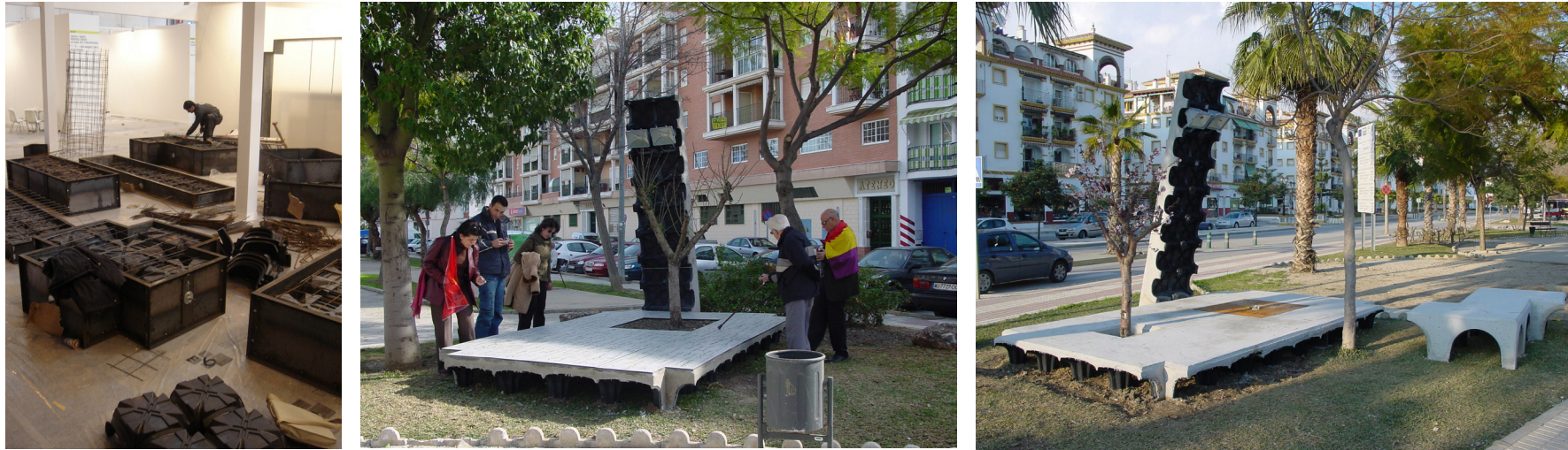
Instalación en ARCO 2006. Plataformas de hormigón, lugares de encuentro y memoria con nombres de víctimas y almendros.

Nuestra propuesta consiste en un lugar de encuentro, un lugar de descanso, un refugio para los fugitivos que vagan por las fronteras del olvido, sin fin errantes, sin reconocimiento y sin consuelo. Ofrecemos un jardín, un lugar de compensación, un espacio de paz, libre de amenazas.